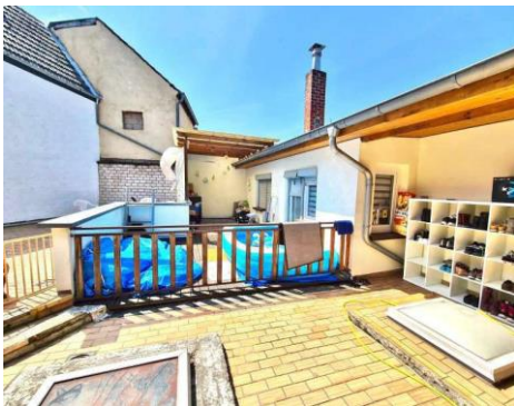
Terrasse 1. OG