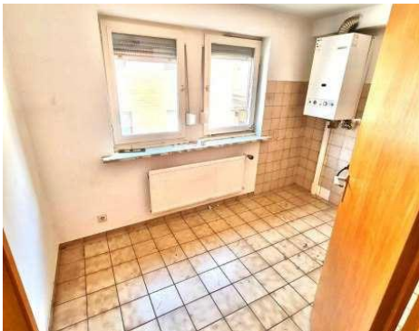
Küche 1. OG