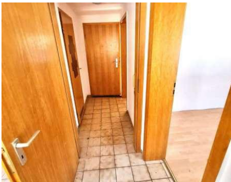
Diele 1. OG