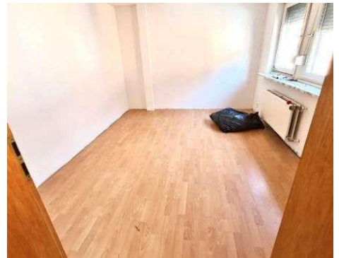
Wohnraum leere Wohnung