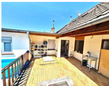
Terrasse 1. OG