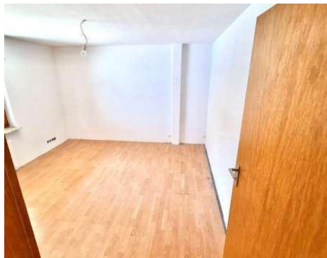
Wohnraum leere Wohnung ...