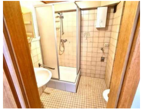
Bad Wohnung 1. OG