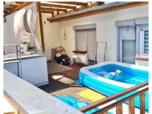
Terrasse 1. OG